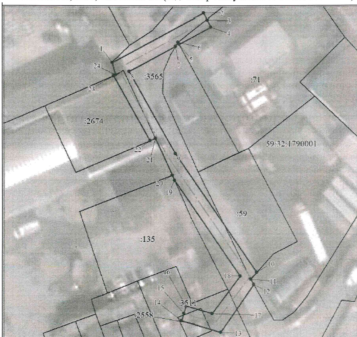
СХЕМА РАСПОЛОЖЕНИЯ ГРАНИЦ ПУБЛИЧНОГО СЕРВИТУТА «Строительство ВЛ 0,4 кВ от РУ 0,4 кВ ТП-7166А, установка оборудования учета э/э на опоре ВЛ 0,4 кВ; Реконструкция РУ 0,4 кВ ТП-7166А (установка коммутационного аппарата 0,4 кВ) для электроснабжения гаража по адресу: Пермский край, Пермский район, д. Хмели, ш. Космонавтов, 3206, Савинское с/п (кад. номер зем. участка 59:32:1790001:0071)»